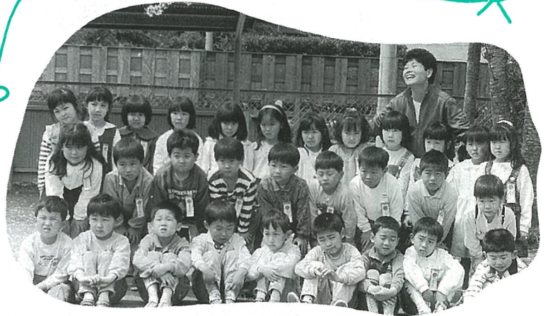
▲ 桜の下での記念撮影