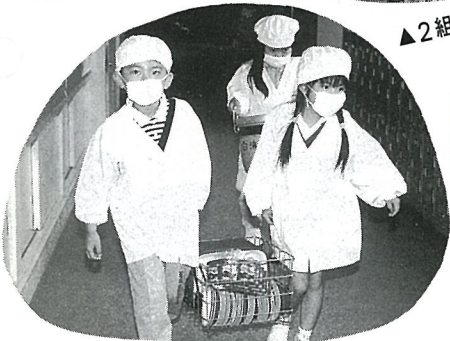
▲ 当番さんが配膳室からもってきます