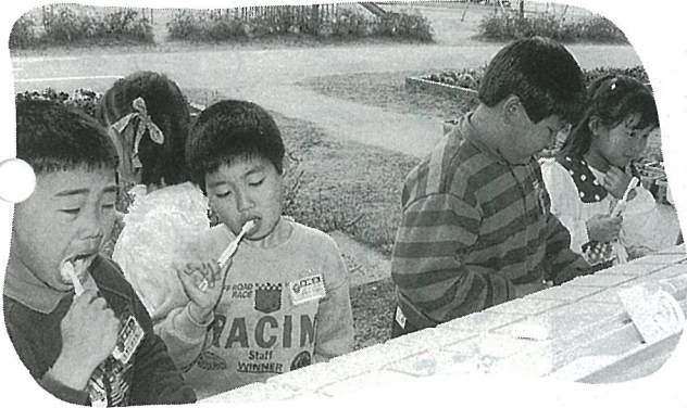
▲ 食事の後、歯磨きもきちんと