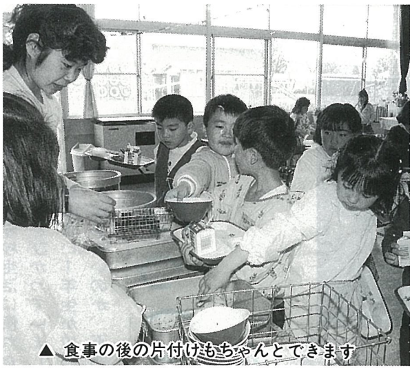
▲ 食事の後の片付けもちゃんとできます