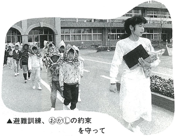
▲ 避難訓練、 お か し の約束を守って ( お さない・ か けない・ し やべらない)

明るい子供たち。少しずつ落ち着いてきています。休み時間が少ないとおこっています。