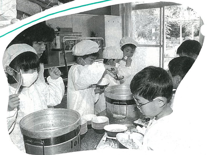
▲「お当番さん、ご飯をよそってね。」 「1列にならんで、こぼさないようにね。」

すっかり学校生活に慣れた一年生の教室では「せんせい。」「せんせい。」と呼ぶ声がとびかっています。せんせいにもすっかりうちとけ、明るく、元気のよい1年生が校庭を教室の中を走り回っています。ちょっと休み時間が少ないのが、不満気でした。