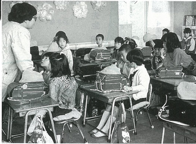
▲ せんせいの話、よ〜く聞いてね