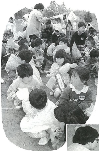
さっそく避難訓練