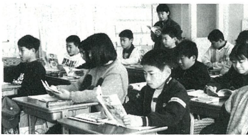
南条小学校児童の紹介