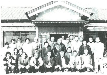
集会所完成を喜ぶ区のみなさん