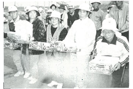
準優勝した宝米Bチームのみなさん

11月8日栗山川の河川敷で日東ゲートボール大会が行われました。昔、日吉に日東青年学校（日吉村・東条村）がありました。両地区は、知人も多く時々ゲートボール大会をして旧友を温めています。