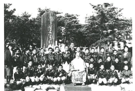
大導師を囲んで白浜小スポーツ少年団

12月27日に、尾垂浜の成田山上陸地で法要が行われました。当日は北風が吹く寒い中、成田山から大導師他50人、地元の関係者、白浜小スポーツ少年団など多数出席し、雅楽を奏でる中、地域の人々の安全をふまえて法楽しました。