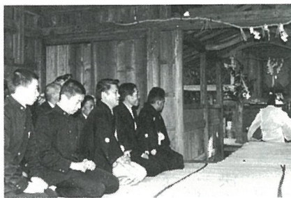
当番の人は正装で出席、当日は15祝も行われました