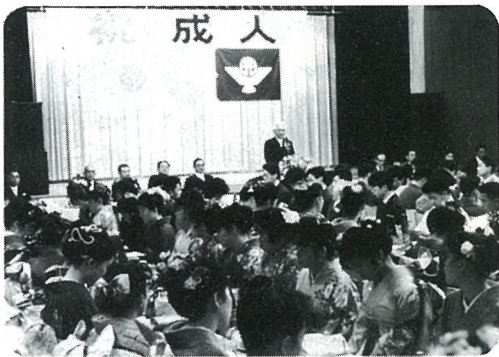
大人の仲間入りをした若人