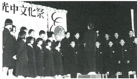
光中学校生徒の紹介