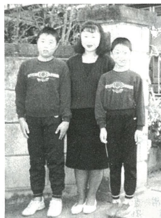
思いやりの気持ちを忘れず成長してほしいと……

いつも、無農薬野菜を作っています。帰る時間帯には必ず家に居る様に心がけてくれています。本当に、有難いと思います。子供たちにも、感謝する気持ちを表す様に、例えば必ず、「ありがとう」などのお礼の