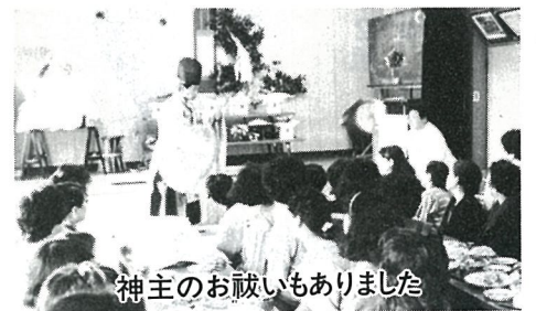
神主のお祓いもありました

11月3日、篠本三区のお神 楽が青年館で行われました。 この日は5谷の女衆約50人 が集まり、お子安様をお慰め しました。お供えもののほか に、昔お神楽を舞った面も供 えられ、女衆が「いい子供が 生まれ、丈夫に育ちますよう に」と玉串を奉納しました。