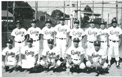
優勝した 橋場エンドレス

第19回老童野球大会の準決勝・決勝が10月21日に 行われました。結果は下記のとおりです。