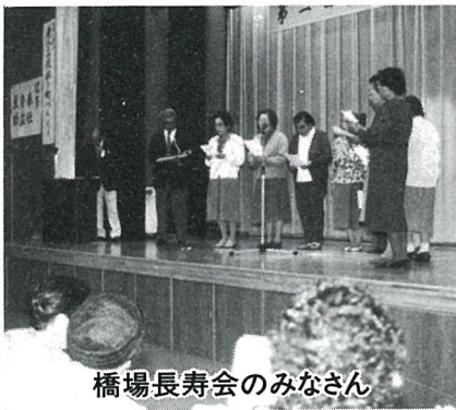
橋場長寿会のみなさん