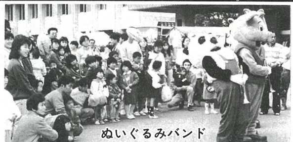
ぬいぐるみバンド