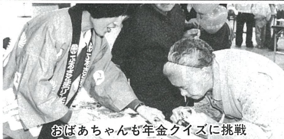
おばあちゃんも年金クイズに挑戦