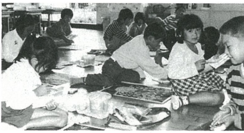
白浜小学校児童の紹介