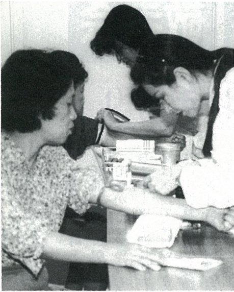
住民検診で健康を確認

また、田から畑への転換を図る客土事業や、ライスセクターの農機具購入に対する補助金などを計上しました。