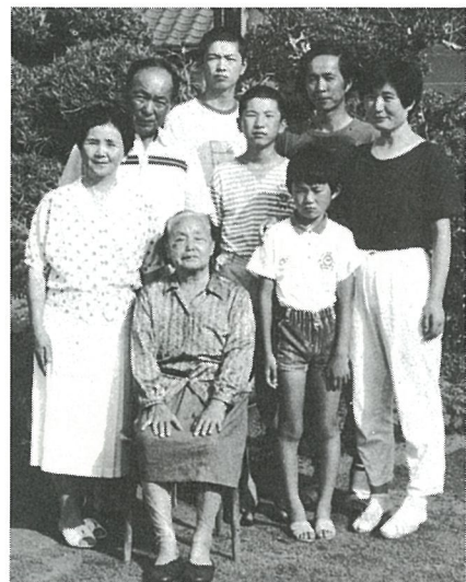
▲食事に注意しているお母さんの心遣い もあり、兄弟3人体格がよく健康

来事を話し合いながらと思 うのですが、現実にはテレビの相 間に来て短時間で食べて、テ レビを見に行ってしまう様な 状態です。皆揃って、賑やか に食事する事もありますが、 そんな時は3人が同時に自分 は話し下手なので、沢山話し