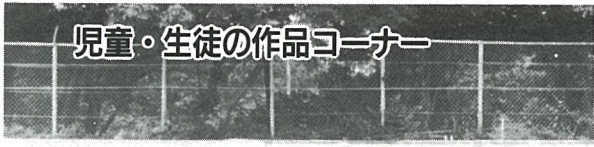
南条小学校児童の紹介