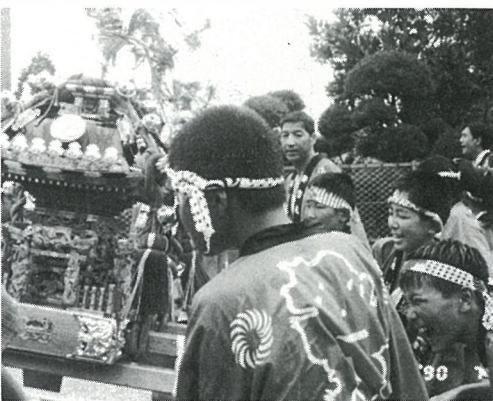
▲元気があった子供みこし(白浜)