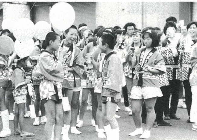
▶メッセージどこまで届くかな(南条)