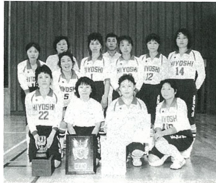
▶準優勝 日吉小ママさん 応援団の汗を流しての 声援に選手たちも好試合を 展開しました。