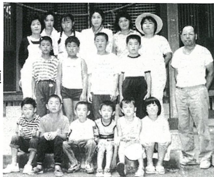
額には 大粒の汗が

8月4日芝崎の小学生とPTAの方がたが、区 なほ の神社掃除をしました。大木が繁り、蟬 せみ の音がするなか、拝殿の回りはみるみるきれいになりました。子供たちは、汗をびっしりかき、「疲れた」の感想が聞かれました。掃除後アキ缶拾い、夕方は肝だめし・花火で楽しく過ごしました。