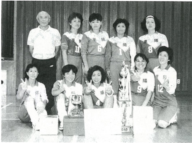
▶優勝、東陽小ママさん 練習の成果が実を結んだ

陽小ママさんが見事3年連続の優勝に輝きました。この結果、トロフィーは東陽小ママさんチームのものになり、次回からは新しいトロフィーで熱戦がくり広げられます。