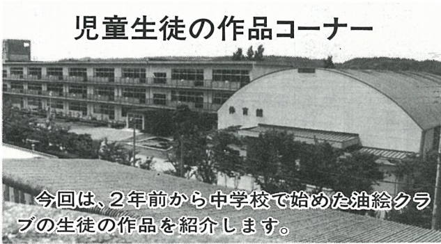
今回は、2年前から中学校で始めた油絵クラブの生徒の作品を紹介します。