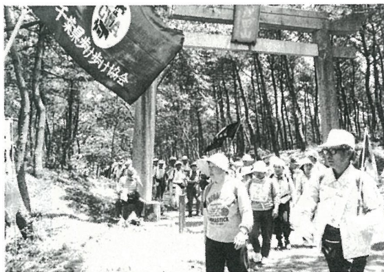
▲ 成田山上陸地を出る参加者