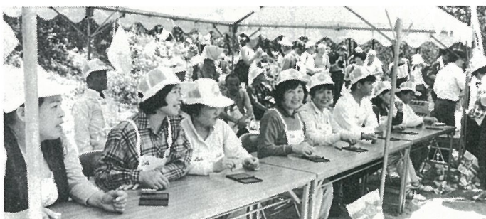
チェックポイントで協力いただいた保健活動推進員の方がた

八日市場市吉崎海岸をスタート、尾垂の成田山上陸地のチェックポイントを通過し大東海岸をめざし歩きました。運動靴にリュック・帽子をかぶり、松林の中を左に波音を聞き、流れる汗をタオルで拭きながら成田山上陸地の鳥居をくぐりました。この日は200人が参加、大阪から来た婦人は、「大阪に見られない景色で素晴らしい。」とまた浦安から来た男の方は、「松林は歩いていて、気持ちがいい。」と話してくれました。成田山上陸地では、保健活動推進員5名の方にご協力をいただきました。