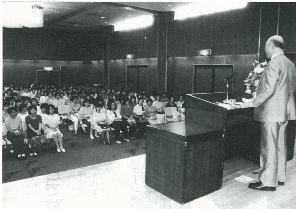
「子どもの上手なほめ方・叱り方」について講演