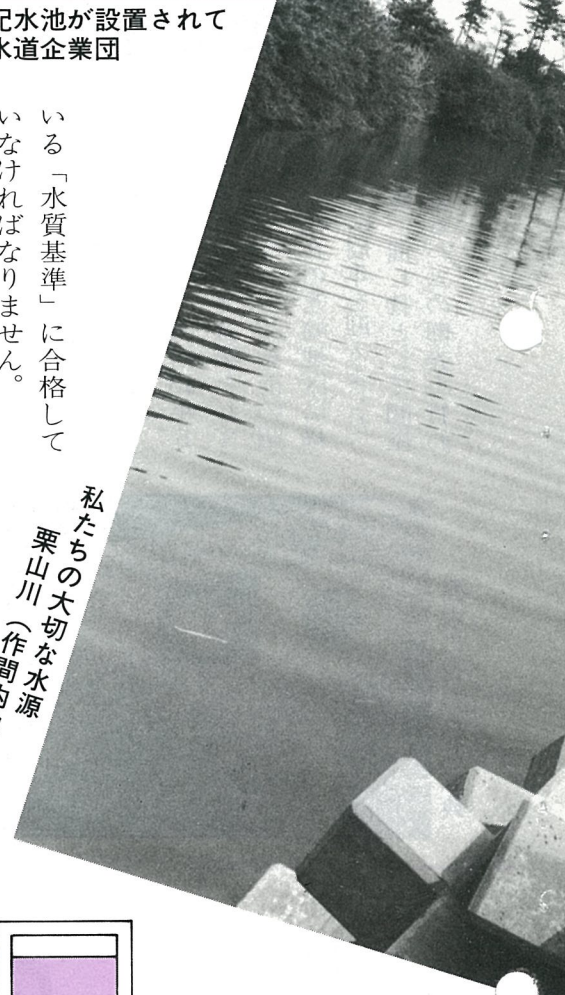
私たちの大切な水源 栗山川 (作間内池先)

この基準には、病原生物に汚染されていないこと、水銀などの有毒物質が基準をこえて含まないこと、色や濁りがないことなど、詳しく定められています。