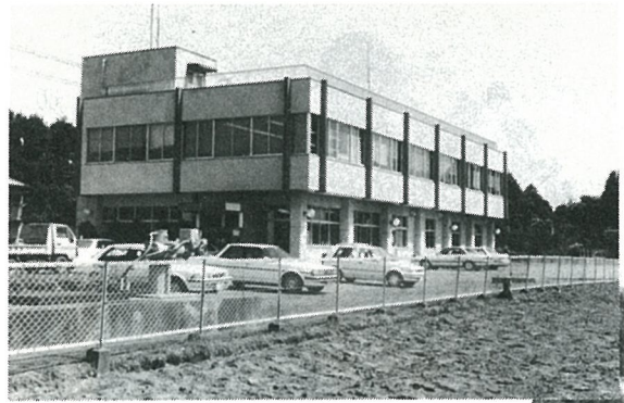
配水場・配水池が設置されている 八匠水道企業団