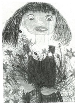
〔コスモスと友だち〕