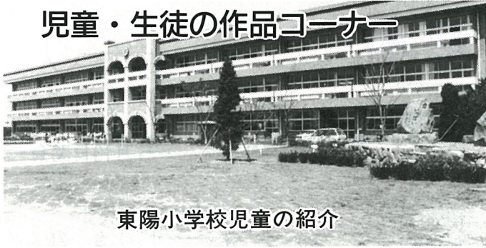
東陽小学校児童の紹介