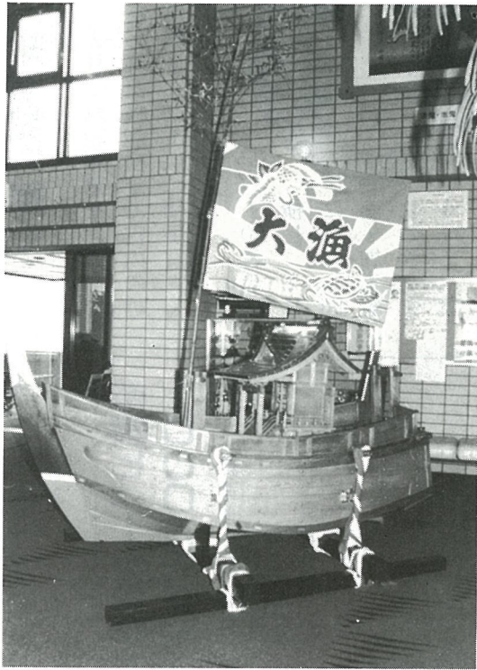
▶長さ2m70cm、重さ200kgの船ミコシ

自治総合センター自治宝くじ助成事業で、ふるさと白浜ふれあいまつり実行委員会が漁業が盛んであった頃を、老人にはなつかしい思い出として、子供達には、郷土の歴史として、理解し語りついで、地域コミュニティの活性化を図ることを目的として、地域の特性を生かした船型御輿を 作成しました。 作成されたお神輿は、5月末日まで町民会館ロビーに展示されていますので、この機会に一度ご覧ください。 また、今年からふるさとまつり等で笛や太鼓に合わせて町内を練り歩き、より一層の住民間のコミュニティづくり に役立てられます。