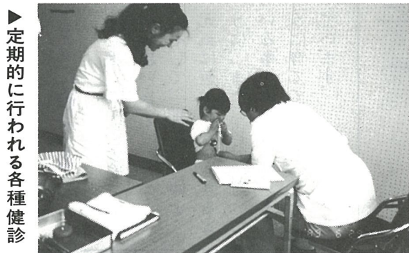
▶ 定期的に行われる各種健診

(事業費 3億972万円) ⑦ 消防施設の整備 (事業費 1,580万円) ⑧ 治山の対策 (事業費 1,350万円) ⑨ 交通安全施設の整備