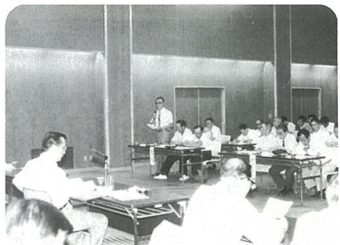
▶ 熱心に意見交換が行われる地区別行政懇談会