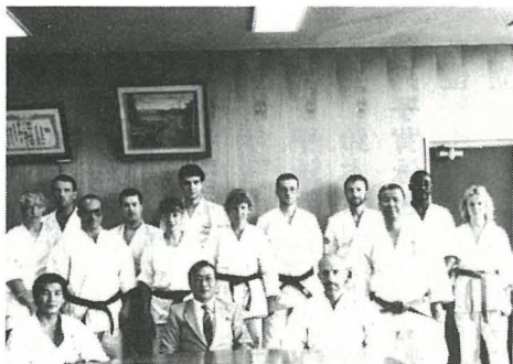
▲来庁したイギリスチーム