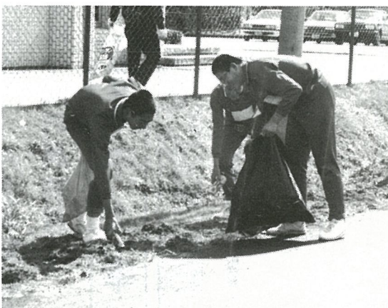
空カンを拾う卒業生

三月九日、光中の卒業生とPTAの方がたが、学校周辺（橋場地区）の空カン拾いを行いました。北風の吹く中、一生懸命に作業をし、たくさん空カンが集まりました。ご苦勞様でした。