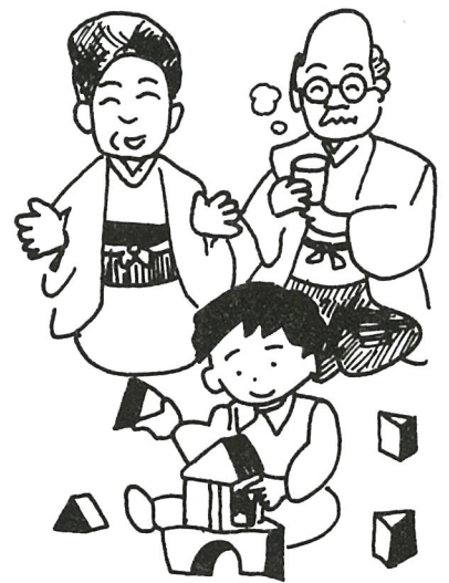
短期給付の支払い月が変わります