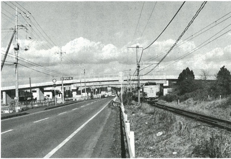
完成間近かのあけぼの橋

申し込み期限 二月二十日 申し込み先 役場産業課振興係 ☎ 84-1211 内線164 なお、参加していただく家族は三家族とし、希望者多数の場合は、抽選等で選ばせていただきます。