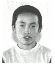
5年 向後 忍