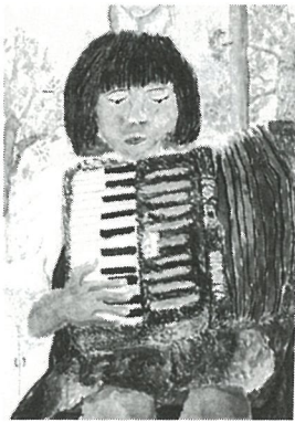
アコーディオンをひく友だち