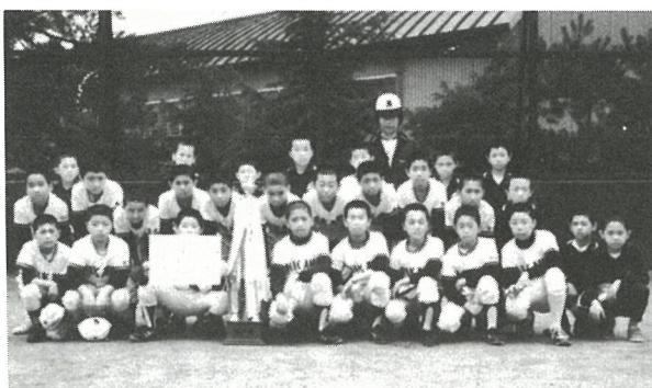
▶ 白浜スポーツ少年団

優勝 白浜スポーツ少年団 準優勝 日吉スポーツ少年団 尚、この二チームは、八月十九・二十日に銚子で行われる東総地区大会に出場します。 優勝目指して頑張ってください。