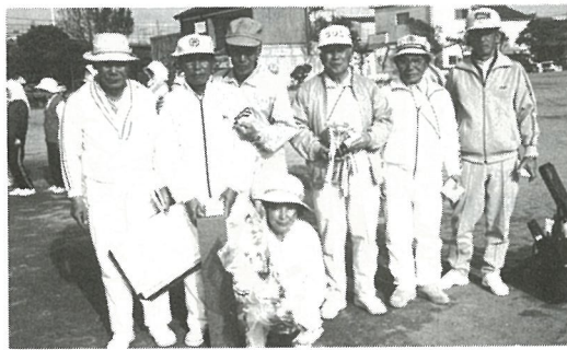
喜びの白浜チーム