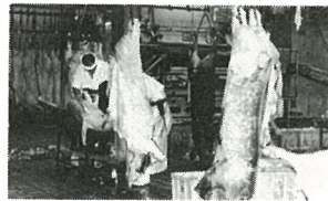
新鮮な肉を供給する (食肉センター)