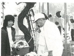
お年寄りの健康管理 を行う