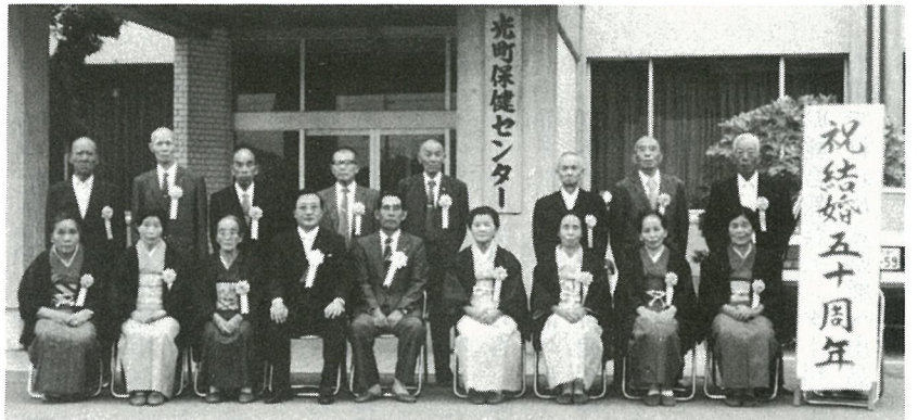
▲ 結婚50周年を迎えた10組のみなさん