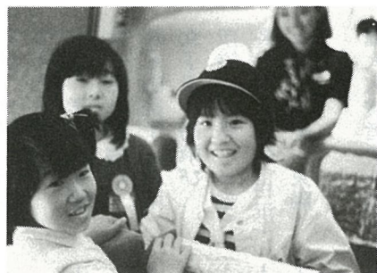
機内でスチュワーデスの帽子をかぶり

光町園芸クラブ主催のさつき展が五月三十日から六月二日までの四日間、町民会館ロビーで開催されました。 今年のさつきは日照時間が影響してか、花のつきが今少しという感じです。それでも丹精こめて作られたさつきが会館狭しと、美を競っていました。 また、展示会と同時に開催された即売会場には会員が持ちよったさつき二〇〇鉢が並び、さつきファンの目をひいていました。 なお、入賞者は次のとおりです。 (敬称略)