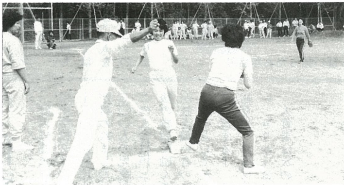
↓おしくもアウト 球の方が先に到着