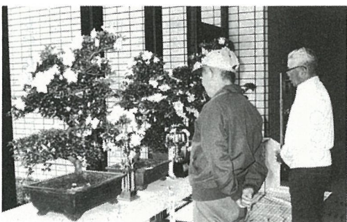
入賞作品をみいる会員