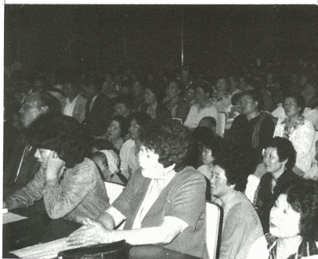
300人も収容できる大ホール