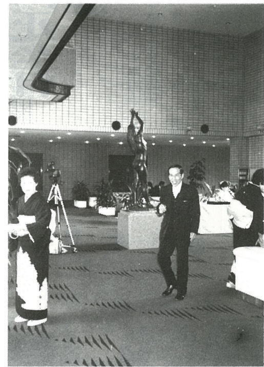
広びろとしたロビー