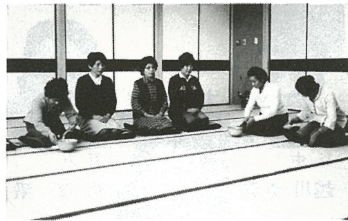
和室でお茶のおけいこ