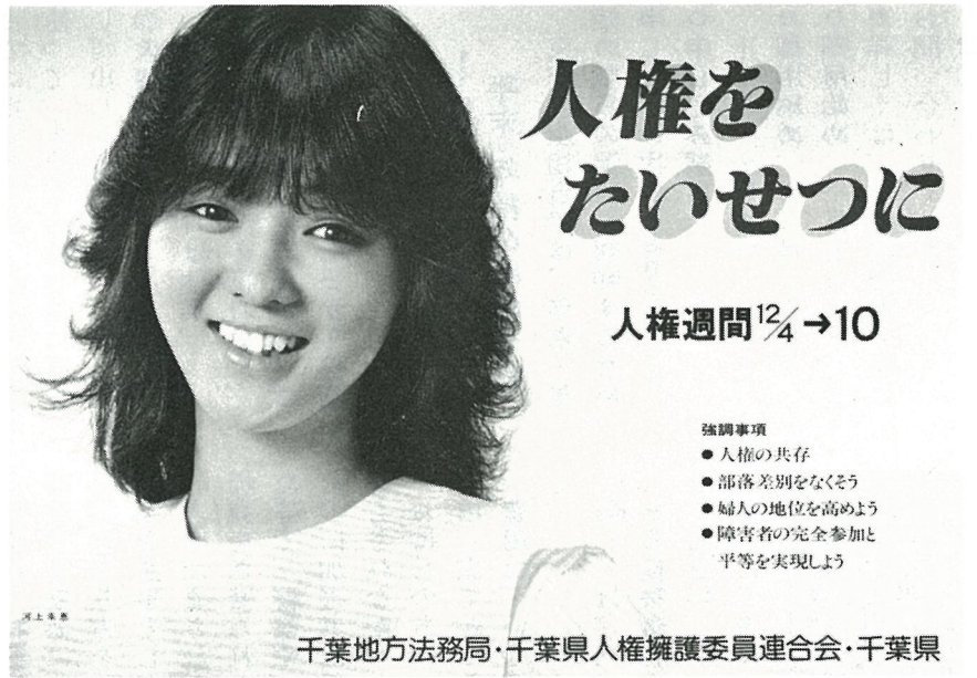
千葉地方法務局・千葉県人権擁護委員連合会・千葉県