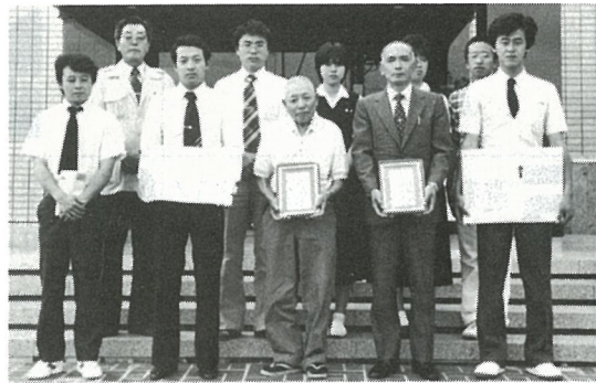
受章者前列とれいんぼうの皆さん