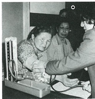
血圧の調子はどうかな

午前十一時から健康と暮らしについての講演、お昼は栄養改善推進員の方がたによる手作りの昼食。メニューは（ご飯・わかめのみそ汁・さばの香り揚げ・キャベツの甘酢づけ・洋風茶わん蒸し・ヨーグルト）、午後は保健婦による健康相談、血圧を測ってもらったり、普段