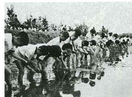
一生懸命植える子どもたち