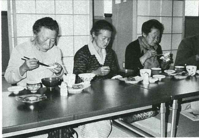
仲間と食べる食事もまた格別

悩んでいることを相談にのってもらったり、とかく孤独になりがちなお年寄りもこの日ばかりは笑顔でいっぱいでした。今回は皮切りに毎月続けていく予定です。何かの都合で出席できなかつた方も、この次はいかがですか。ぜひお出かけください。そして仲間の輪を作ってみてはいかがでしょう。