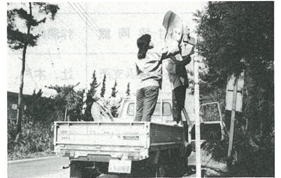
丹念に磨きあげる 青年クラブ員