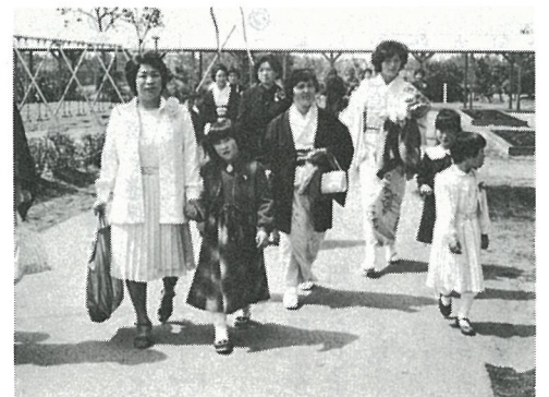
お母さんに手を引かれて……

四月六日の入学式に東陽小学校を訪ねてみました。どの子も真新しい服装に身をつつみ、希望に胸をふくらませ小学校の門をくぐったことでしょう。