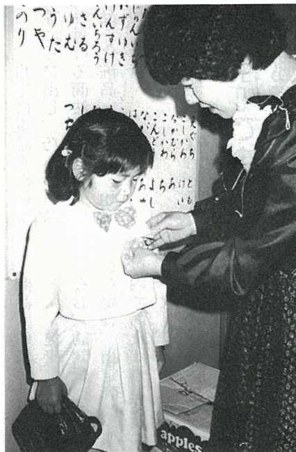
お母さんに組別のリボンをつけてもらって……