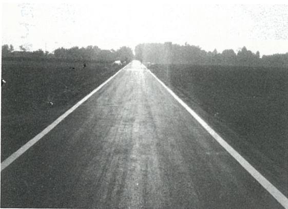
58年度 古屋・入線舗装新設工事