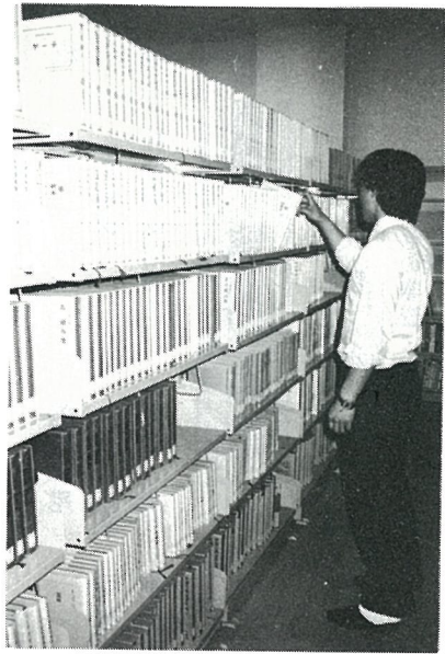
きちんと整頓された本棚

休館日や時間外に本を返す場合は、町民会館の玄関にあるクリーム色の返却ポストに入れてください。