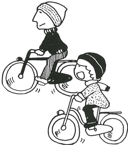
自転車の並進は事故のもとになります

には正しい自転車の乗り方を教えてあげてください。また、自転車を通してルールとマナーも身につけさせましょう。 ○体に合った自転車を選ぶ いずれ大きくなるからと、足が地面に届かない自転車を買い与えるのは危険です。サドルをまだいで、両足が完全に地面につくものを選びましょう。 ○乗る前に必ず点検しよう ブレーキはよくきくか ライトはつくか タイヤの空気は入っているか そのほか、ハンドル、サドル、ペダル、ブザーやベル、反射器材、チェーン、ネジなどの具合も点検するようにしてください。 ○一時停止で、安全確認する 「一時停止」の標識(標示)のある場所や見通しの悪い交差点では、必ずいったん止まり、左右の安全をしっかりと確認させましょう。