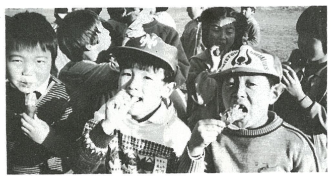
おいしそうにいもをほおばる子ども…

十一月五日に篠本三区営農組合の協力により児童たちが掘ったいもで、十二月一日、運動場でもいも煮会が行われました。運動場の片すみに仮設のかまどを作り、煙が目にしみてこすりながら、児童たちも手伝って炊きあげたいも…学年ごとに別れて試食しました。 普段はおやつでも「なんだ、いもか」といいかねない子どもたちも、お友だちと食べるいもはまた別のいもなのでしょうか。お互いが競争しあって食べていました。