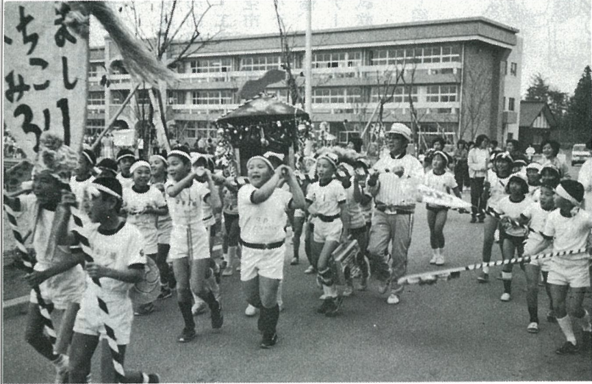
威勢よくみこしのくりだし