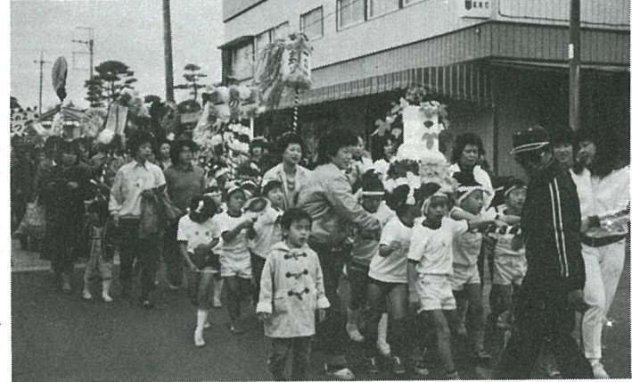
東陽小から産業まつり会場へ