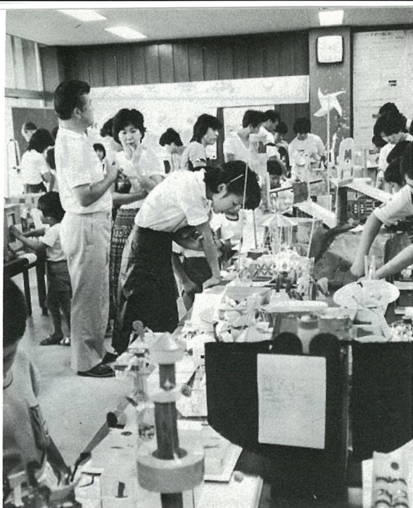
人気を集めた科学工夫展(八日市場公民館)

アイデア抜群の工作をはじめ、野草や身近な自然の観察記録、植物、昆虫の標本などたくさん作品が展示されました。会場には大勢の親子連れがためかけ、お友達の作品を見て、来年への作品のヒントを得ている子どももいるようでした。