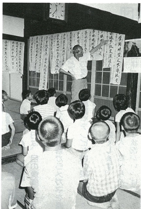
論語を読む子どもたち(作間内お寺で)

そんな表われの一つか、脱いだ靴は自分で揃えて上がる、小さな習慣が自然と身についているようです。