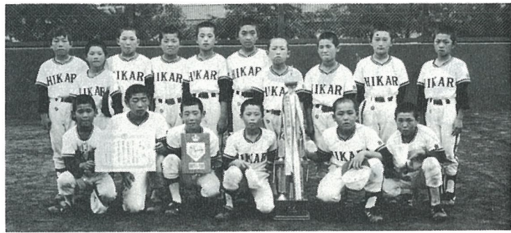
喜びの白浜チーム

青少年相談員主催による町内少年野球大会が夏休み初日の七月二十一日、小雨の降る中、東陽小学校と尾垂球場を会場に行われました。 どのチームも日頃の練習の成果を存分に発揮、健闘した結果白浜チームが決勝で南条チームを敗り優勝しました。 なお七月二十三日、二十四日の両日、野栄町で行われた千葉日報杯少年野球大会には、白浜