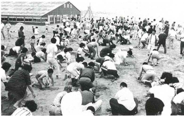
宝さがし、負けてたまるか…

磯で遊ぶ者、泳ぐ者、砂のベットで昼寝を決めこむ者、思い思いの夏を存分に楽しんでみてはいかがですか。