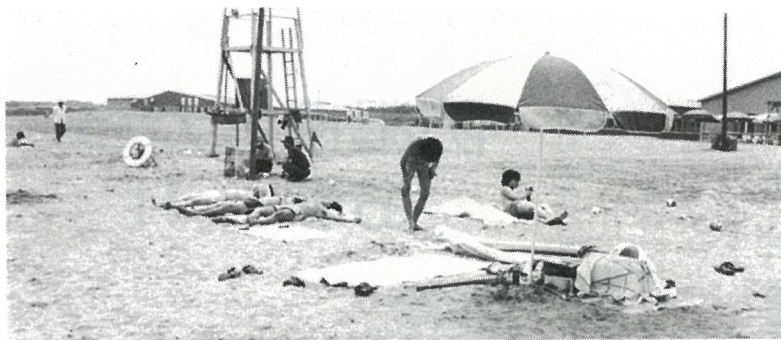
砂のベットは快適かな？