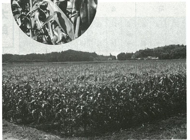
農用地利用増進特別対策事業による暗渠排水で転作可能になった水田(台)