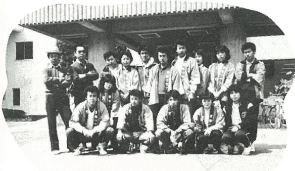
なかまになりませんか