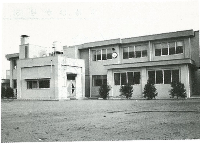
完成した白浜小学校