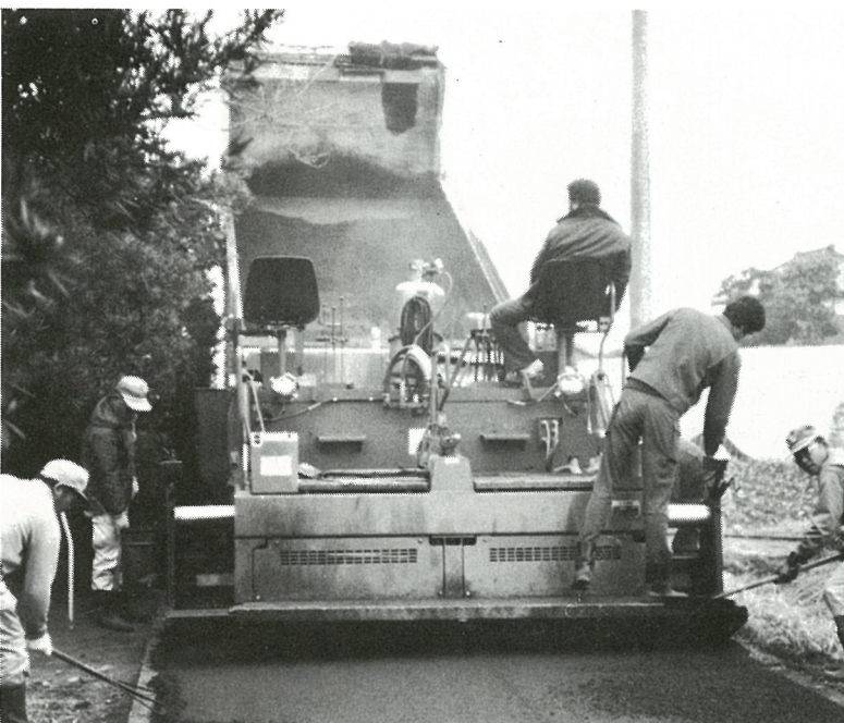
直営舗装工事 入地先