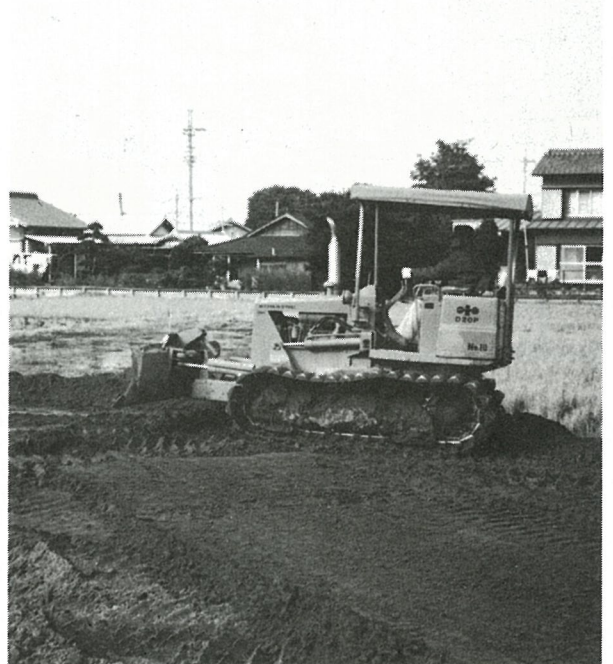
客土工事 篠本地先