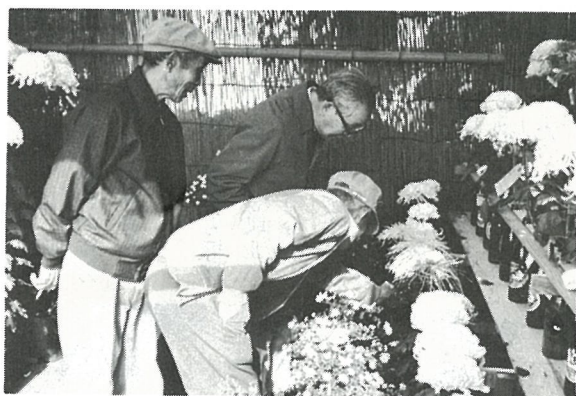
丹精込めて作られた菊花を見る町民