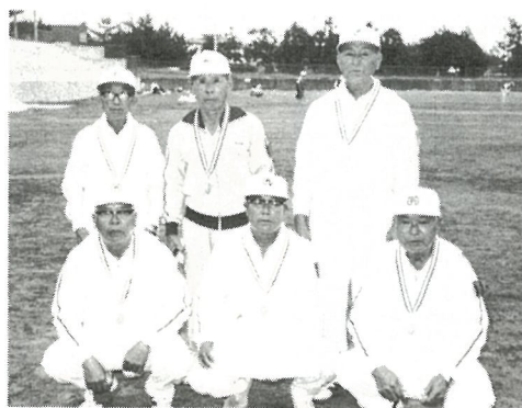
優勝の南条チーム