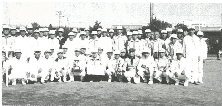
大会参加者全員で

晩秋の日射しの照りつける十月二十一日、銚子市唐子町公園で海匝郡市老人スポーツ大会が三市四町から五百名が参加して盛大に行われました。当町からも五十名が参加、個人六種目、団体二種目に元気な姿でがんばり、昨年に続いて二年連続優勝をなしました。