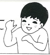
わがやの プリンス・プリンセス