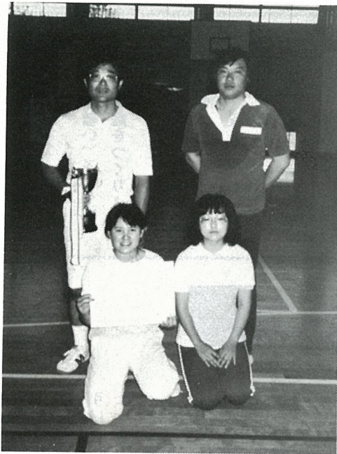
団体優勝の関チーム