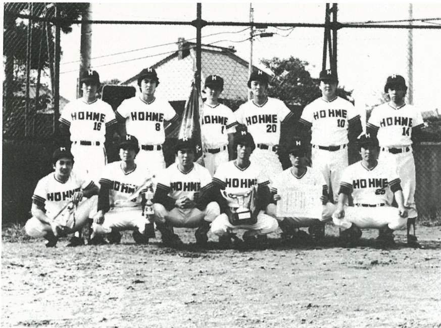
2年連続優勝の宝米Aチームナイン