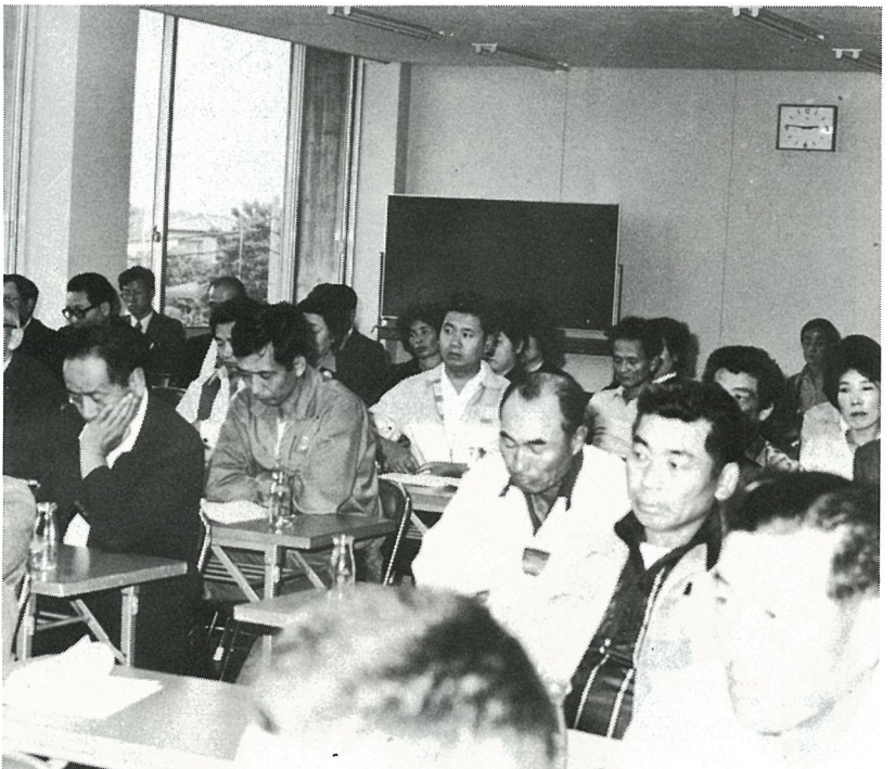
対策を考える会議出席者