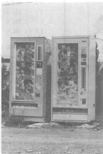
このような販売機をなくそう