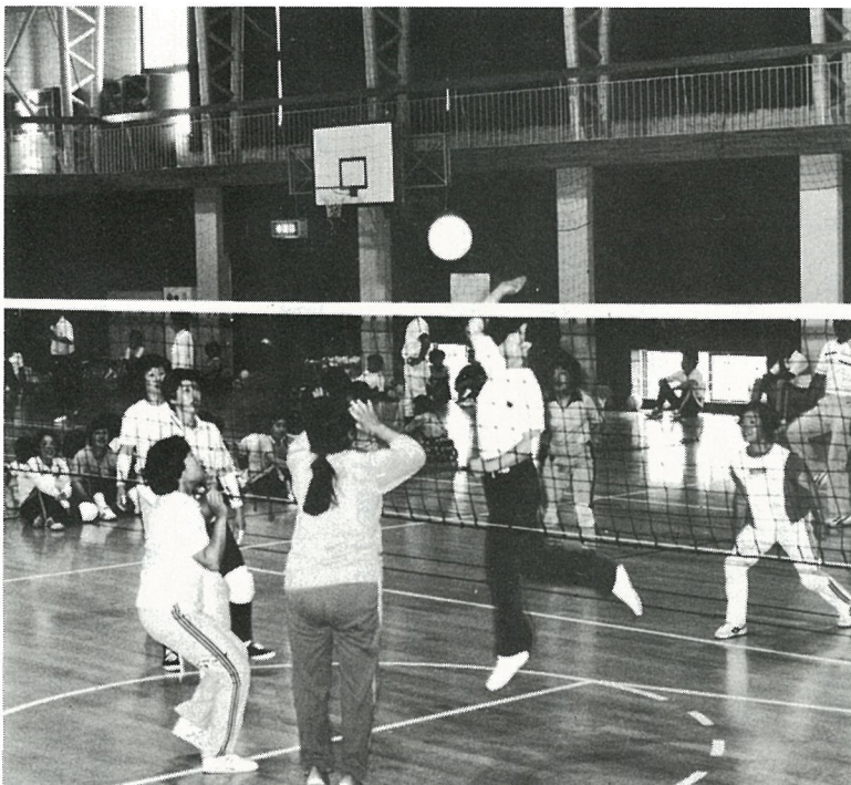
子供たちの声援にハッスルプレー