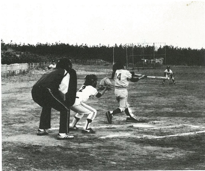
高めの球に手を出して