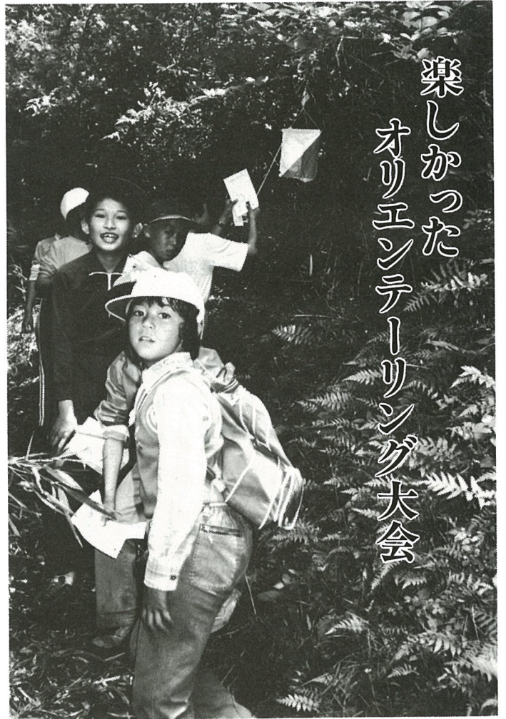
楽しかった オリエンテーリング大会